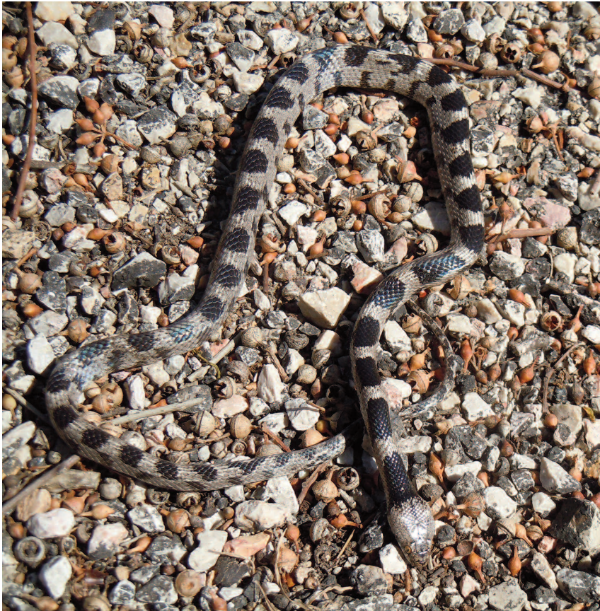
Fig. 6 — Esemplare ♂, trovato morto, di Telescopus fallax dell'isola di Oinousses (Lt 51,3 cm).

Osservazioni - Gli esemplari sono stati trovati morti al margine di una strada asfaltata che attraversava una zona molto arida, parzialmente coperta da formazione a frigana. Il primo esemplare (un giovane adulto) era stato investito e le sue condizioni non hanno consentito di poter effettuare misurazioni e/o conteggi. Il secondo invece (un ♂) appariva integro (Fig. 6), per cui è stato possibile ricavarne i seguenti dati morfometrici e meristici: lunghezza totale 51,3 cm (coda 9,1 cm); rapporto codale 4,6; 19 file di squame dorsali a metà tronco, 208 + 1/1 squame ventrali, 67/67 + 1 squame sottocaudali; presentava 34 macchie nere mediodorsali; sono stati notati acari sulla coda. Nome locale: "ochià".