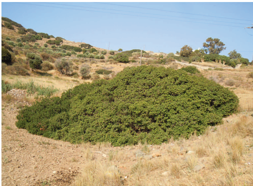
Fig. 14 — Habitat di Montivipera xanthina dell'isola di Lipsi.

mento alle particolari condizioni ambientali dell'isola. Le macchie a forma di losanga della sua ornamentazione, soprattutto quando il rettile è arrotolato, le garantiscono un'effetto somatolitico straordinario. Durante le operazioni di studio dei caratteri meristici ha mostrato comunque una reattività impressionante, simile a quella riscontrata nella sottospecie M. x. diana e della vicina isola di Leros, ma non nelle altre popolazioni studiate della specie. Emette escreti difensivi di odore simile a quelli prodotti dai rappresentanti del genere Elaphe ( s.l. ).