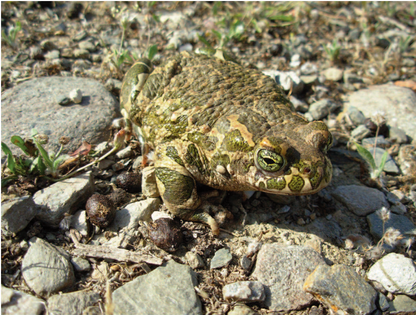
Fig. 3 — Esemplare di Bufotes viridis dell'isola di Oinousses.

Osservazioni - Due adulti sono stati trovati sotto pietre, uno sotto materiale ligneo di scarto (Fig. 3) e uno investito su strada asfaltata nei pressi dell'abitato. Le larve (a stadio precoce) si trovavano in acque sorprendentemente basse derivanti dalla percolazione attraverso un muro di recinzione nei pressi di un invaso. Il surriscaldamento di queste acque basse comunque, causando l'accelerazione dei processi di sviluppo, accelera la metamorfosi delle larve, a tutto vantaggio della specie, sia che l'acqua tenda ad evaporare sia che persista.