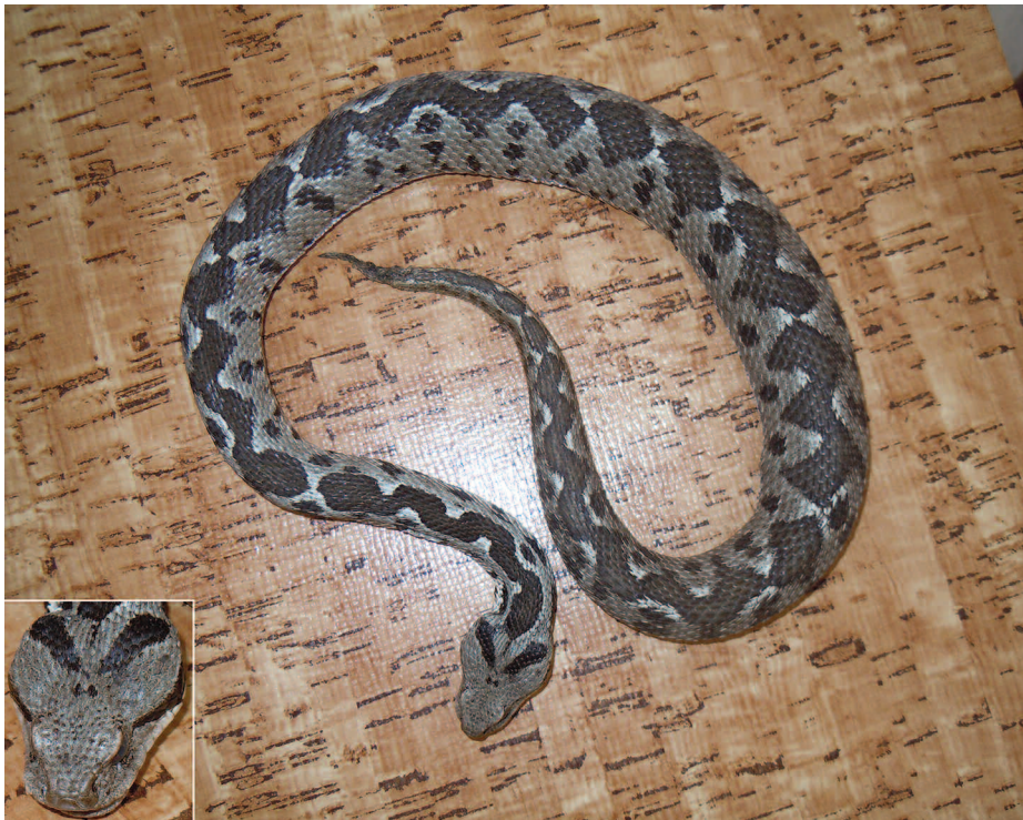
Fig. 8 — Esemplare ♂, trovato moribondo (vd. testo), di Montivipera xanthina dell'isola di Lipsi (Lt 58,5 cm) (nel riquadro in basso a sinistra si può notare meglio la particolare morfometria del capo).